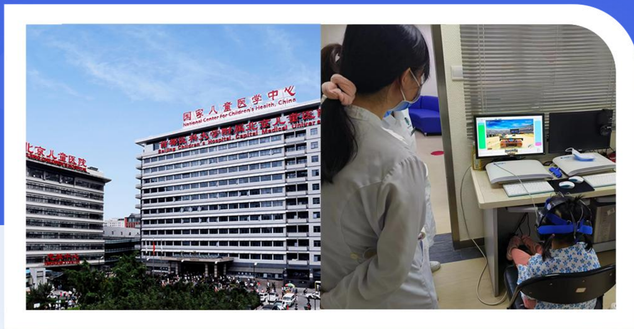
国家儿童医学中心